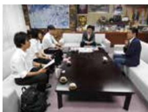
↑インターン生と倉田市長の意見交換

←西尾章治郎 大阪大学総長に、キャンパス移転後の粟生間谷活性化への支援を要望し、快諾を得る